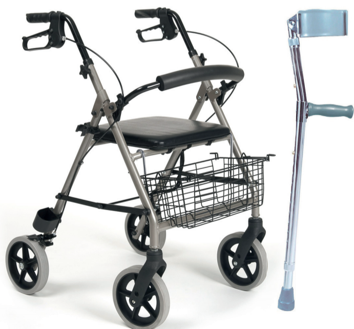
BALKONIKI I KULE